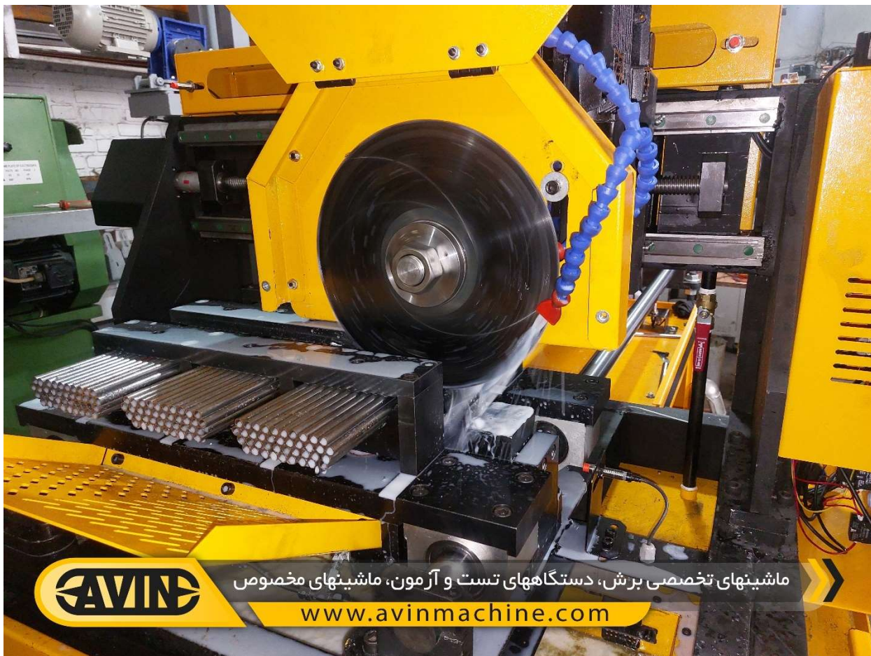
نمایی از برش لوله در ماشین اره آبصابونی اتوماتیک برش همزمان لوله مدل MTC-103-02