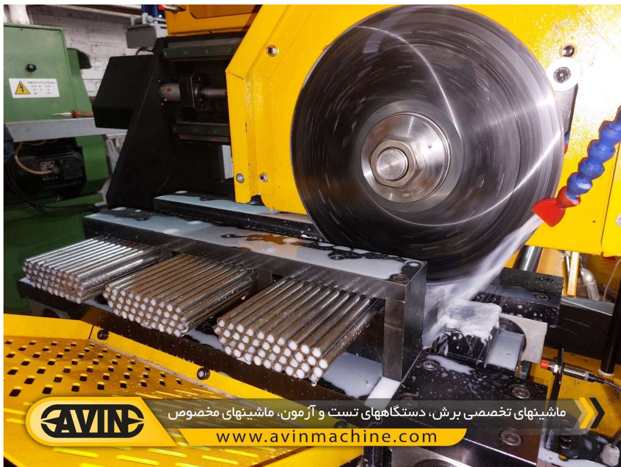
نمایی از برش لوله در ماشین اره آبصابونی اتوماتیک برش همزمان لوله مدل MTC-103-02