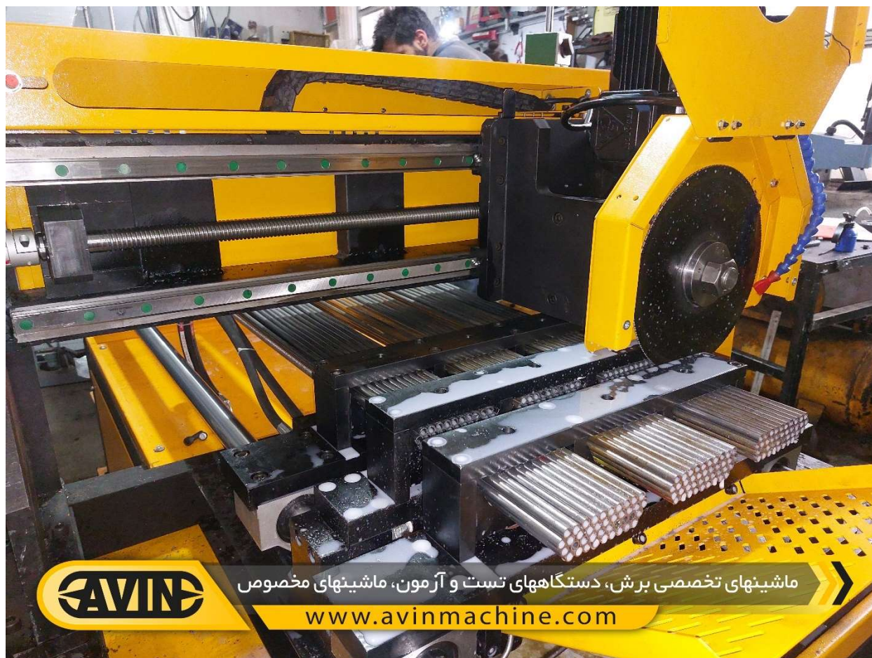
نمایی از برش لوله در ماشین اره آبسابونی اتوماتیک برش همزمان لوله مدل MTC-103-02