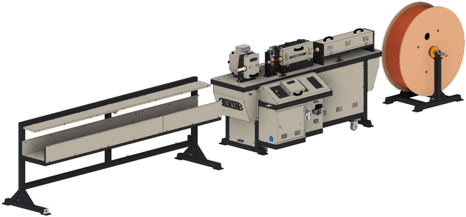
نمای کلی ماشین صاف کن و برش دیسکی لوله مسی مدل CTC-202-05